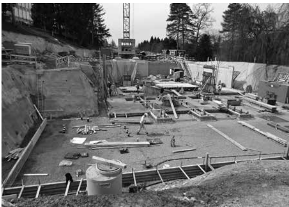
Hier eine Ansicht des Bauplatzes, aufgenommen Ende März 2015.

Das Volumen des Neubaus ist beachtlich und umfasst rund 11 460 m 3 umbauten Raum. Oder anders ausgedrückt: wir verbauen ein Betonvolumen von rund 1800 m 3 , vermauern etwa 176 700 Klinkersteine als Vollsteine und in neun verschiedenen Formsteinen. Am Ende der geplanten Bautätigkeit wird das neue Krematorium in einer parkähnlichen Umgebung zweigeschossig in Er-