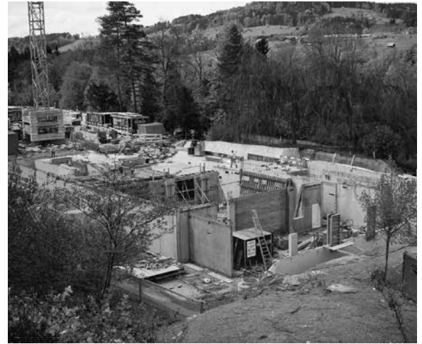
Ansicht des Bauplatzes, aufgenommen Ende April 2015.

scheinung treten. Die Höhe des Gebäudes beträgt knapp 15 m, misst man von der im Erdgeschoss versenkten Ofeninstallation aus. Der markante Kamin des Gebäudes ragt weitere 10.1 m in die Höhe. Die Gesamtbaukosten belaufen sich auf knapp 20 Mio. Franken.