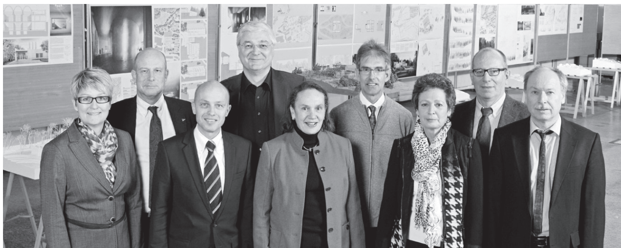
Stiftungsrat und Geschäftsführung ab Mai 2012

Ich beginne für einmal, womit man üblicherweise schliesst, nämlich mit einem ganz herzlichen Dank. Gedankt sei – und dies nicht einfach nur floskelhaft, sondern getragen von einem echten Bedürfnis – allen unseren Mitarbeiterinnen und Mitarbeitern für ihr grosses Engagement und ihren umsichtigen Einsatz, sowie unseren Vertragsgemeinden für die unkomplizierte und gute Zusammenarbeit, die wir auch im letzten Jahr wieder erleben durften.